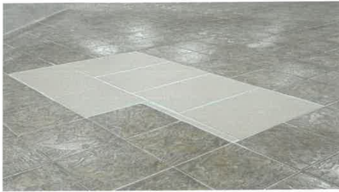
수영장 남자샤워실 내부 바닥타일 부분교체