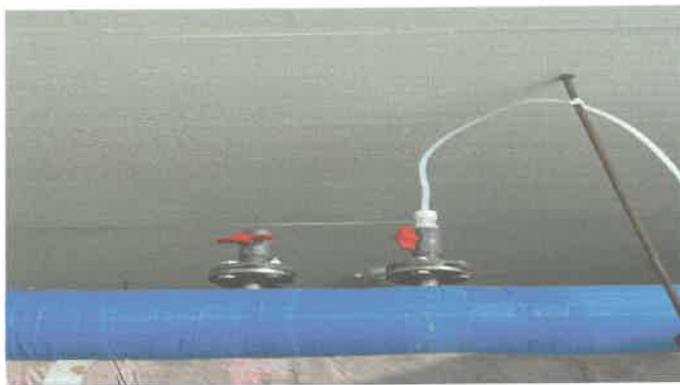
기계실 정량펌프 커넥터 및 배관 청소