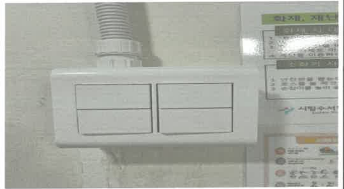
수영장 남자탈의실 4구 교체